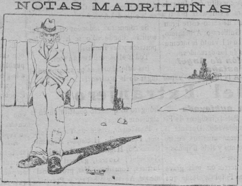
LA CARESTIA DEL PAN Y LAS ELECCIONES — ¡Lo peor es que este año ni aun vendiendo el voto podré comprar un panecillo!