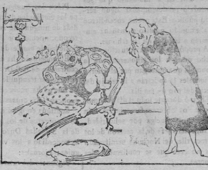
El abuelo - Rico, moni, ¿qué quieres ser tú? El niño (sin titubear). - ¡Acaparador!