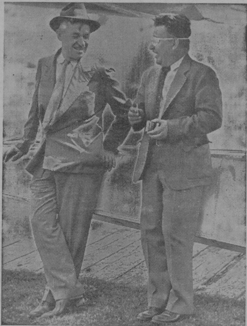
ACCIDENTE DE AVIACION.—Wiley Post y Will Rogers, el famoso actor cinematográfico momentos antes de salir para su malogrado vuelo a Moseou, en el cual perecieron los dos cerca de Alaska. (Fotografía por avión desde Stattle).

Si no se consiguiera, sería posible una catástrofe para ambos contendientes, pues si bien a primera vista parece que Mussolini, es demastado inteligente para arriesgarse a perderlo todo en una jugada, algunas veces los hombres geniales, como indudablemente lo es el «Duce» italiano, están propensos por su misma altura a cometer errores irreparables. Napoleón el grande, verdadero genio, político y militar, se equivocó al luchar contra nuestra independencia, y en las campañas de Rusia. Y le pudiera ocurrir igual a Mussolini, y que los preparativos realizados para