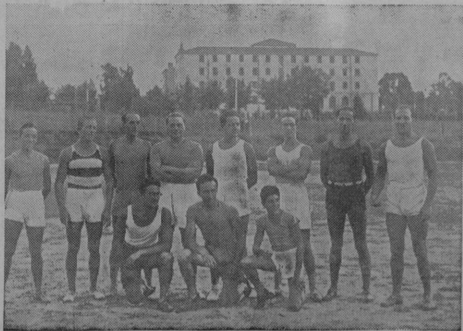
ATLETISMO.—Grupo de atletas de la selección de Castilla que tomarán parte en los Campeonatos de España de Atletismo.