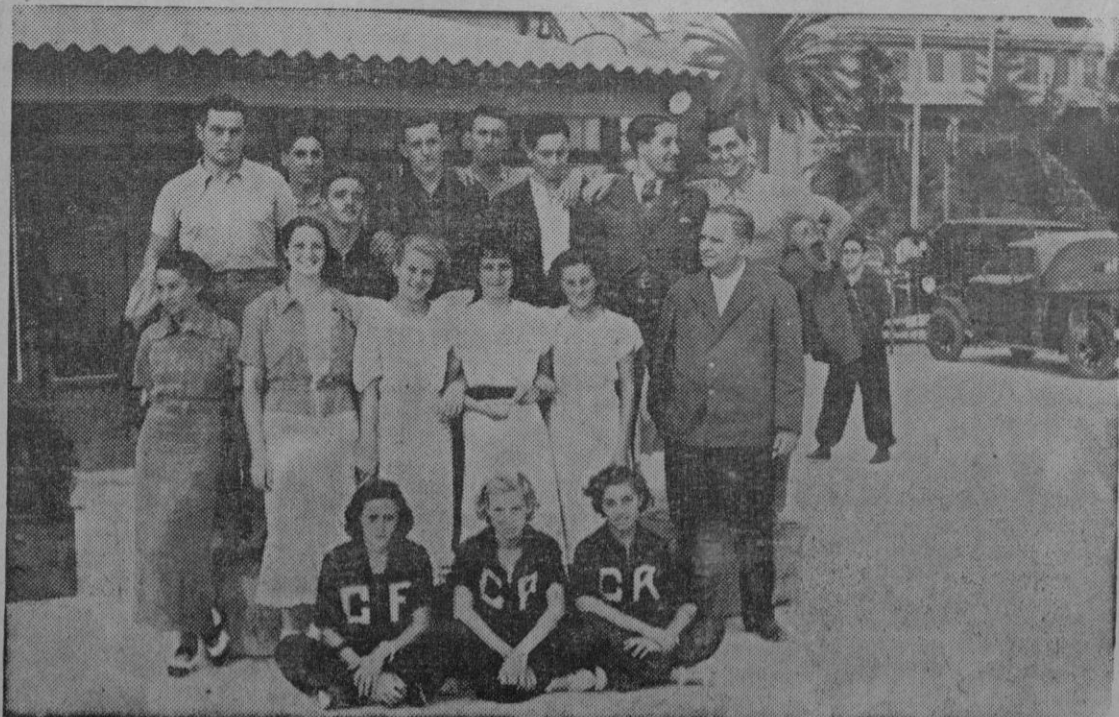
EL C. N. BARCELONA EN PALMA.—Grupo de los defensores del Club Barcelonés con varios elementos del C. Regatas

por otros centros docentes a que acude este mismo público. Cualquiera que un público, temas vitales para él, desatendidos por sus centros docentes, serán con toda probabilidad, si no necesidad, puros problemas. Problemas germinantes o en crecimiento aún no atacado—como