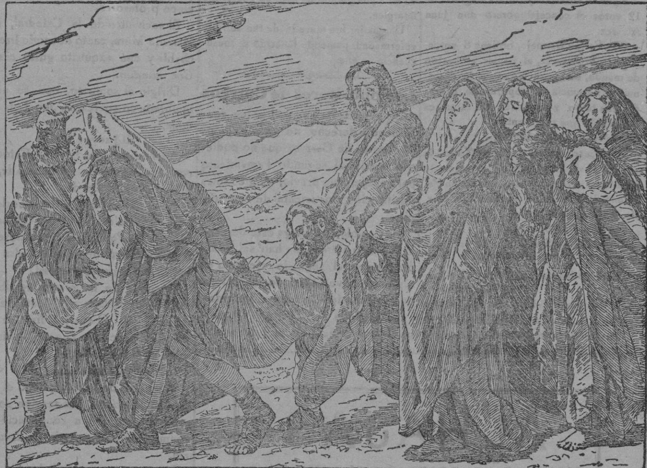
EL ENTIERRO DE JESÚS