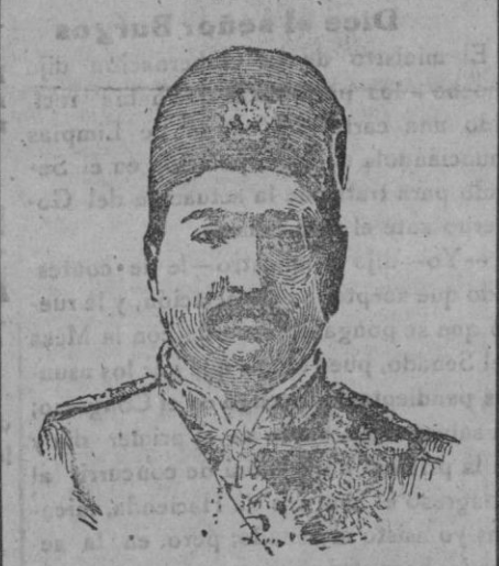
Ali-Mirza, Sha de Persia, que después de visitar Londres, ha llegado a París, siendo muy bien recibido.