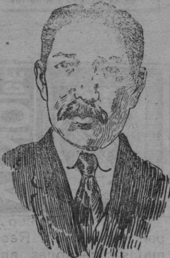
El Vizconde de Chinda, diplomático japonés que se encuentra en París representando a su país, en las conferencias de la paz