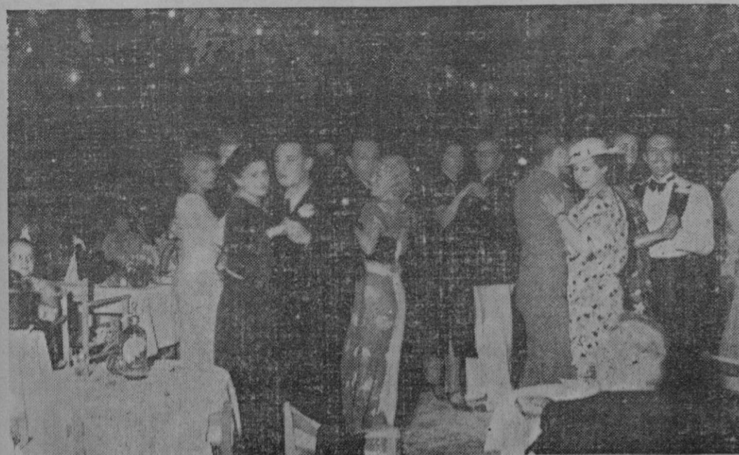
«HYI CUAQUIN, QU' HAS VENGTUT DE PRIM...»—Una interesante escena del sainete regional, letra de don Sebastián Rubí y música del maestro don Antonio M.ª Servera, estrenado anteanoche con gran éxito en el Teatro Principal.

Tardieu, en cuya política se reúnen las fuerzas conservadoras del país, recoge admirablemente un movimiento de índole nacional. Las izquierdas, con su predominio, han llevado a término lo que en España, felizmente, no cuajó en toda su miseria y depravada amplitud. Apoyan, hasta el más turbio halago, a las masas de funcionarios y obreros urbanos, oponen junto a esta preferencia, una franca animosidad contra la agricultura, que tiene amplia y