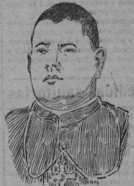
DON MARCIAL LÓPEZ CRIADO, nombrado Obispo de Cádiz, que será consagrado dentro de breves días, en la Catedral de Córdoba, donde ha sido Magistral.