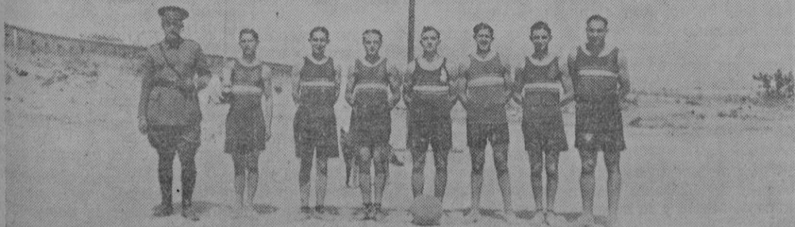
BASKET-BALL.—Equipo de Artillería tracción mecánica ganador del Trofeo cedido por la Federación Balear

Advertimos a nuestros comunicantes que toda la correspondencia relativa al periódico, debe ir dirigida a la Dirección de mismo.