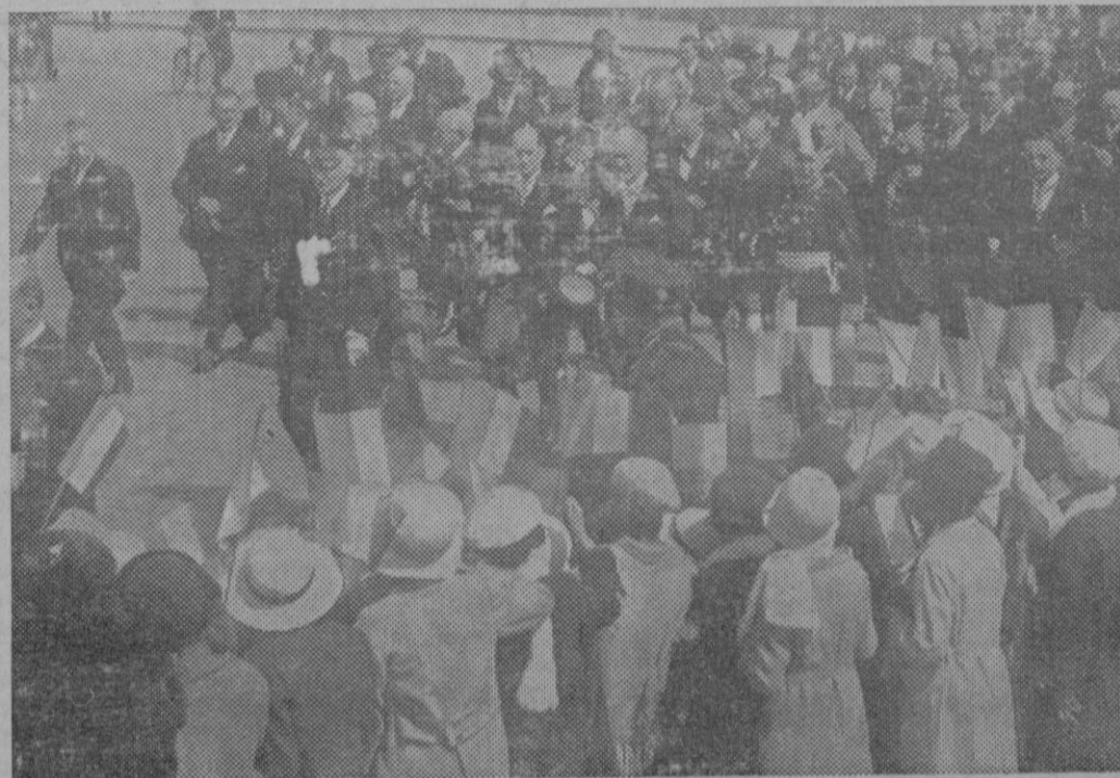
FRANCIA.—El Presidente de la República Francesa, M. Lebruns llega a Reims para presidir los actos que se celebran con motivo de las fiestas en honor de los vinos de Francia.