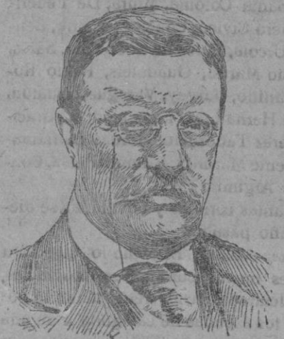
TEODORO ROOSEVELT, ex presidente de los Estados Unidos, que ha estado en peligro de muerte.