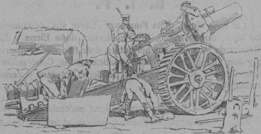
Tipo de obús de grueso calibre de los empleados actualmente por el ejército inglés para bombardear las posiciones alemanas en Francia.

curso de experimentación práctica, jiras o visitas a las exportaciones agrícolas más progresivas del contorno o a los Centros oficiales de agricultura más próximos, así como almuerzos o comidas de carácter íntimo, que sirvan para crear y estimular lazos de amistad y compañerismo.