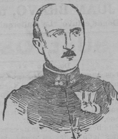
EL CONDE CLAM-MARTINIĆ, nuevo presidente del Consejo de ministros de Austria.

La concurrencia a estos bailes, seguramente será muy numerosa y abundarán las muchachas de buen palmito , especialmente en «La Unión Moderna», donde son los bailes de Carnaval muy notorios por la asistencia a dicha sociedad de las bellas y pizpiretas modistillas, que son el mayor atractivo de ese salón de recreo.