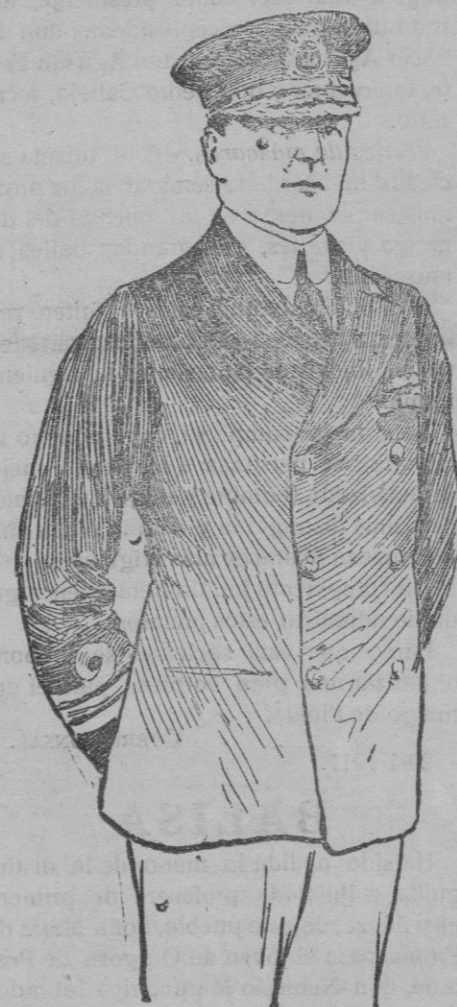
SIR DAVID BEATTY

comandante en jefe de la escuadra británica, a cuyas disposiciones se debe el último combate naval.