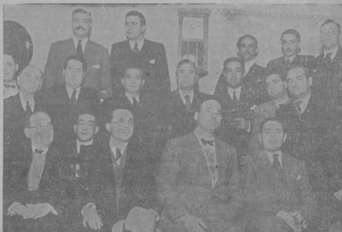
GREMIO DE ULTRAMARINOS Y COMESTIBLES.—inauguración del local social. Junta Directiva de dicha entidad y comisiones del Boletín y de Contratación de artículos del ramo.