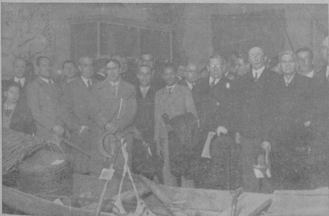
LA EXPEDICION DE IGLESIAS AL AMAZONAS.—Madrid.—Inauguración de la exposición de Etnología amazónica con material recogido por el Capitán Iglesias.