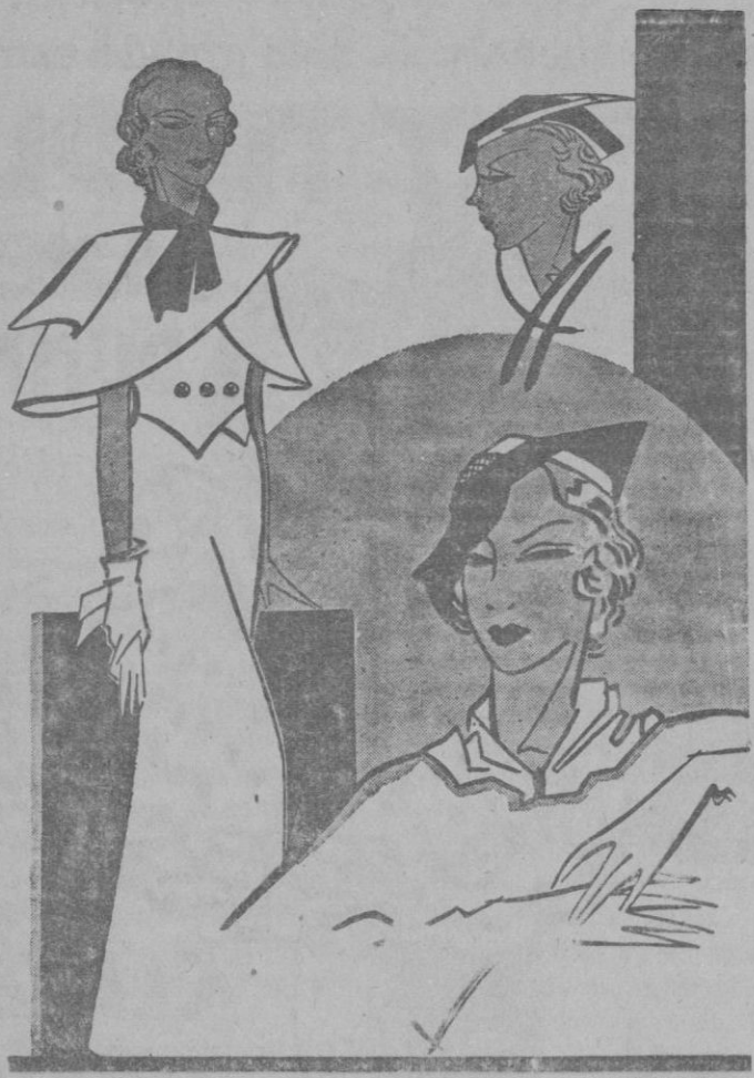
Trajeito-capa de hilo azul El adorno es sencillamente un lazo de punto en color rojo.—Sombrero de paja verde adornado con tiras de fieltro duro, imitando la pluma cuchillo.—Sombrero con paja natural y fieltro marrón.—Guantes de cabritilla. Nótese que desaparecen completamente los pespunte gruesos y los adornos. (Apuntes de París) Dibujo de Jaralz.

ca mentalidad de las esposas ha empujado a millares de maridos a hogares ilegítimos.