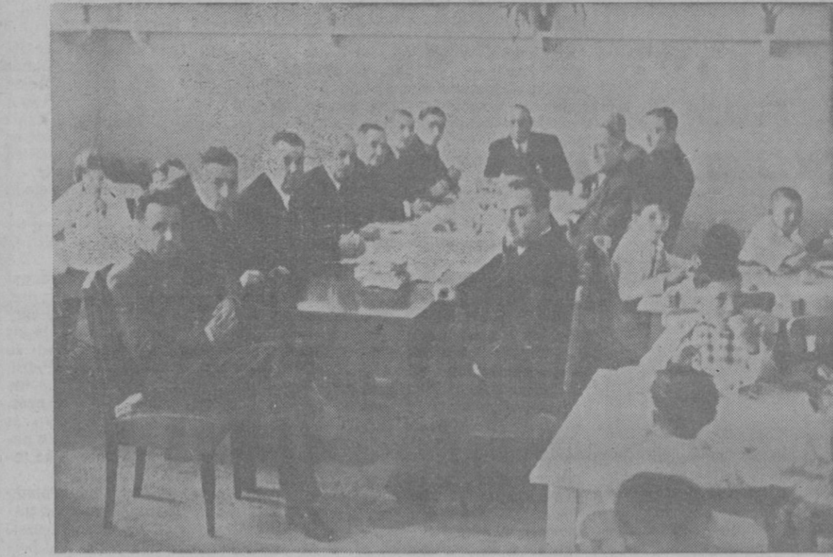
LAS CANTINAS ESCOLARES.—Ayer mañana se inauguró la cantina del Grupo Escolar de Son Espanyol, asistiendo las autoridades, que comieron con los pequeños, simpático momento que ha recogido el objetivo de nuestro reporter gráfico.

Si los teorizantes del insularismo se colasen en una combinación futura el aliento dado a la política de seguridad aérea de mutualidad es tal, que no serían capaces de contrarrestar