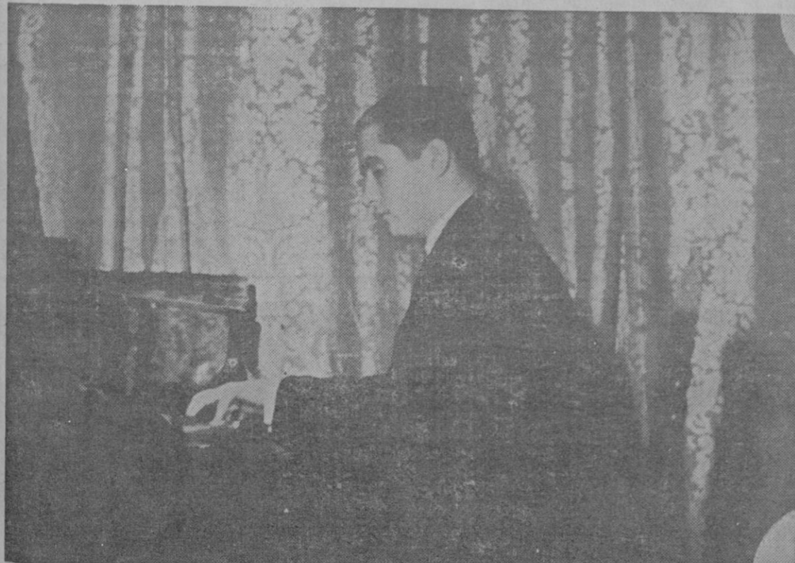
CONCIERTO DE PIANO.—El famoso pianista, Joaquín Nin-Culmell, que el martes dió un magnífico recital en el Palacio de la Almudaina, interpretando a Bach, Chopin, Schumann, Albéniz y Manuel de Falla.