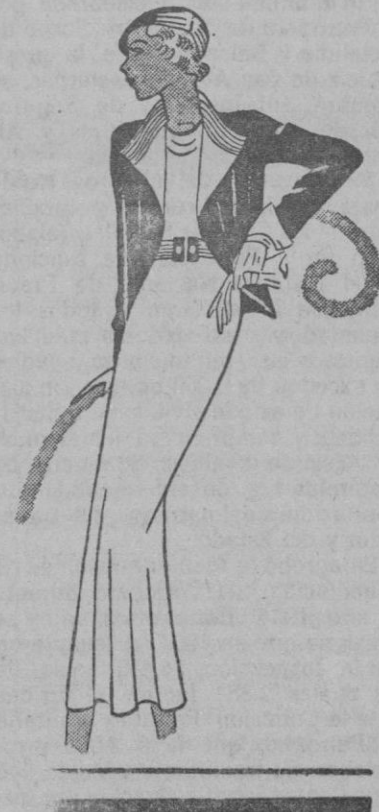
Vestido de lana azul-gris y chaquetita de ante azul oscuro, las solapas son de lana. El turbante hace juego con el vestido. (De París) Jaralz.

Para tres o cuatro personas, ocho patatas de regular tamaño. Se pelan perfectamente, se lavan en varias aguas y se cortan en cuadrillos regulares. Se ponen en una cacerola con un pequeño pedazo de mantequilla y setenta y cinco granos de azúcar, un poco de vainilla o algunos pedacitos de cáscara de limón y dos o tres cucharadas de agua. Se dejan cocer, a fuego lento, teniendo buen cuidado de remover de vez en cuando para que se una todo bien. Cuando esté bien cocido, se pasa todo por un pasador muy fino y se vierte en una compotera. Se puede, también, espolvorear con un poco de azúcar y pasarlo por encima un hierro caliente para que forme una capa de