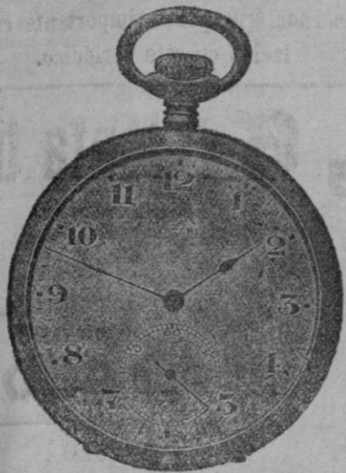
Reloj Misteria J. M.