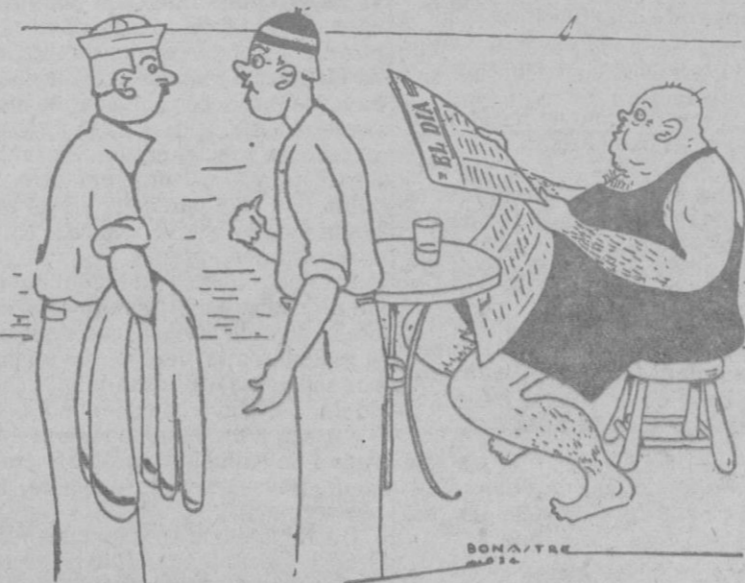
—A qué hora es la pleamar en esta playa? —Eso es según a la hora en que se baña este señor.

El ministro de Comunicaciones dijo refiriéndose al incidente de Oviedo en virtud del cual suspendió de empleo y sueldo a seis funcionarios indisciplinados; que si precisara suspendería a toda la plantilla de la población.