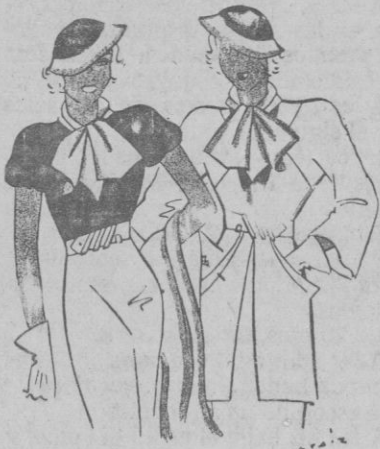
Conjunto de sport. Jersey de punto de «arroz» azul marino. Gorrita en fieltro blanco y azul. Falda, lazo y abrigo en lana blanca. (Nota de París).

Para evitar la aparición de la sobtabarba, es necesario ejercitar los músculos de la garganta y el cuello mediante torsiones, flexiones y elevaciones de la cabeza.