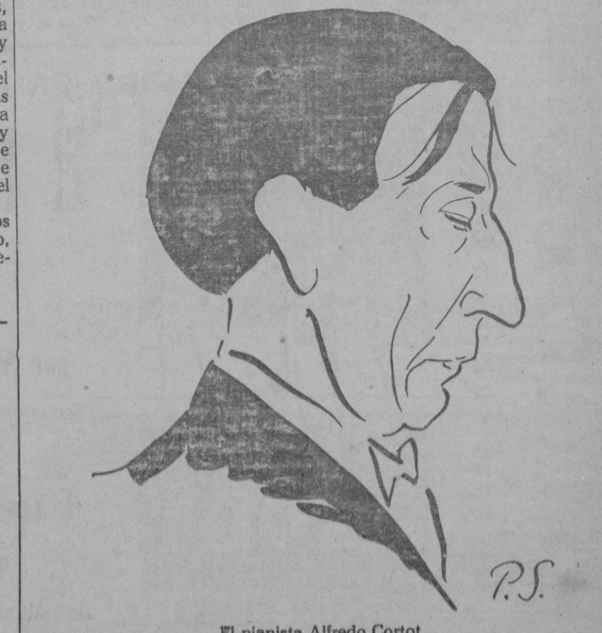
El pianista Alfredo Cortot

En una granja de labor se presentan un día los guardias. ¿Fulana de Tal? Allí está. Trabaja allí en la Granja. Querele interrogarle el juez