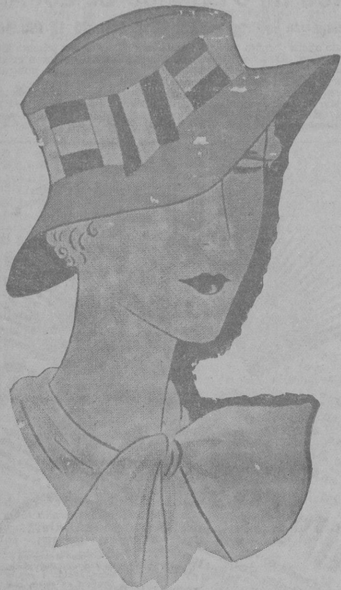
Sombreros de verano en fieltro ligero. Los adornos en cintas de colores vivos.