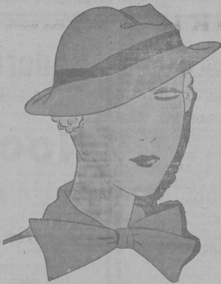
Sombreros de verano en fieltro ligero. Los adornos en cintas de colores vivos.

Para acompañar vuestra falda oscura, llevad un bolero de taffetas cuadrado sobre el cual, doblais gentilmente el bucle o cuello de vuestra blusa de china o hilo.