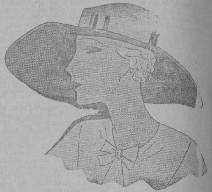
Sombrero en paja de Italia.

Por la tarde escoged una mousseline vaporosa sembrada de grandes flores de todos los colores. Nada es más bonito y tendréis un vestido encantador que despertará la admiración.