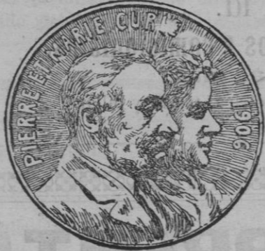
Mr. Pierre Curié y su esposa

La Academia de Ciencias de París, conmovida por la trágica y prematura muerte de uno de sus más ilustres miembros, Mr. Pierre Curié, el modesto y glorioso descubridor del radium, ha tenido la idea de hacer grabar una medalla que reproduzca el retrato del insigne químico y el de su esposa, dedicada como él y en su colaboración á las tareas científicas. Tanta es la competencia de esta señora, que como es sabido, acaba de suceder á su esposo en la cátedra de la Lorraine que él regentaba.