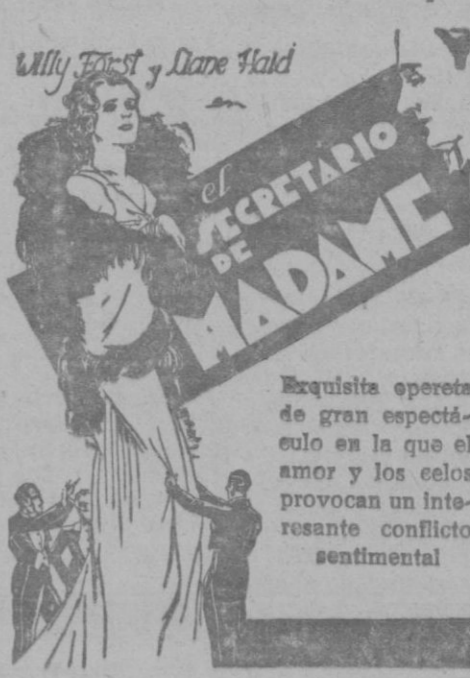
Exquisita opereta de gran espectáculo en la que el amor y los celos provocan un interesante conflicto sentimental

Bellas canciones e inspirados temas musicales, del célebre compositor Robert Stolz