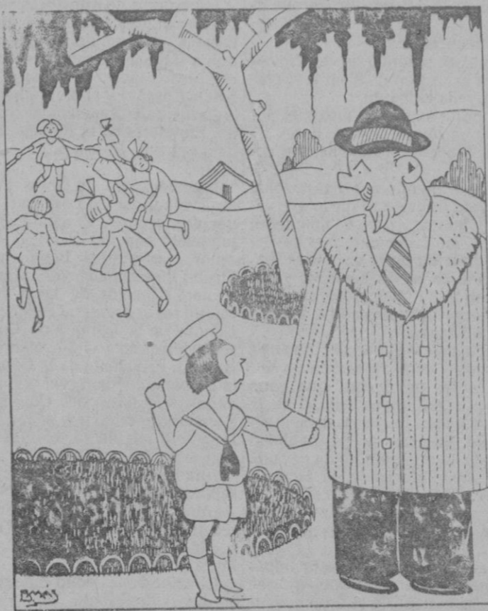
—Abuelito, mira esas niñas como juegan. —Eso me recuerda cuando era como ellas. —¿Has sido niña tu también?

El señor Maciá ha comunicado al Gobierno que la Generalidad acordará una subvención importante para que Cataluña esté debidamente representada en las fiestas del 14 de Abril.