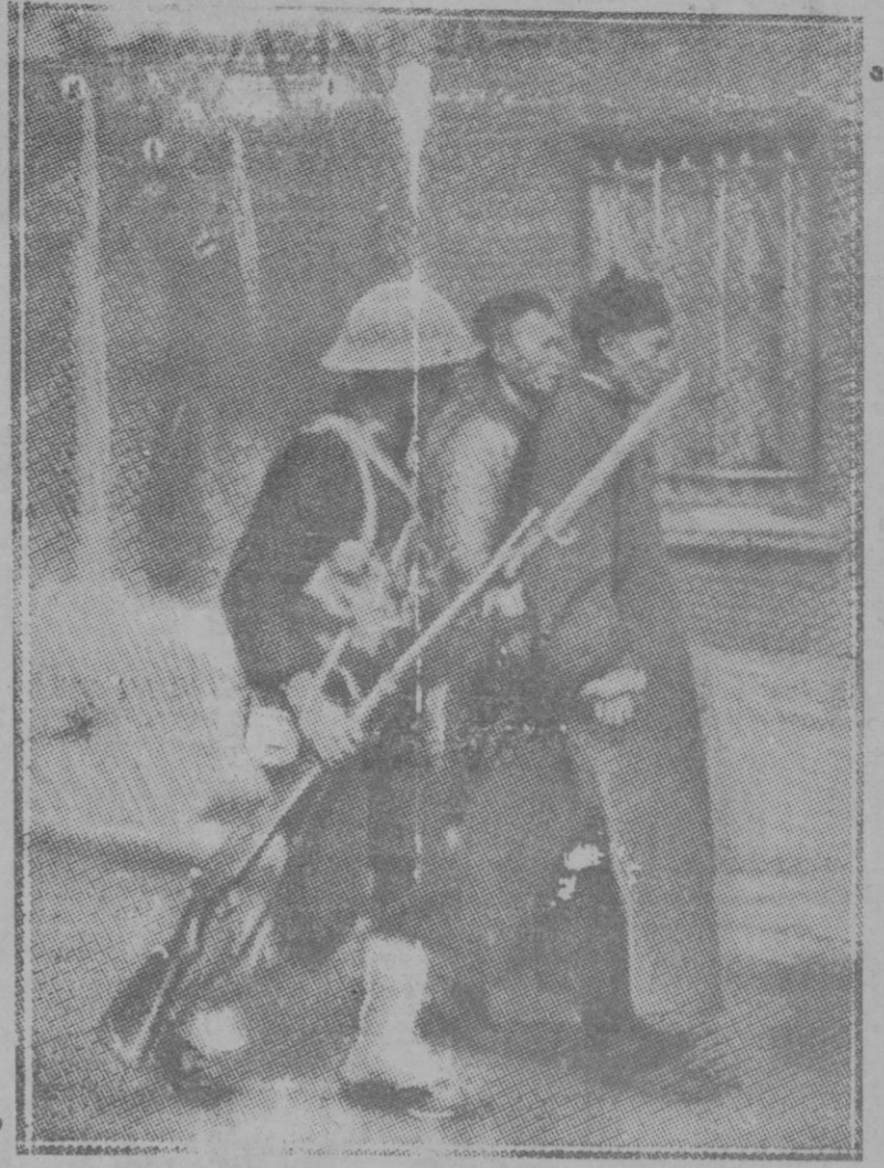
Un soldado de Marina japonés conduciendo a dos prisioneros chinos al cuartel general

Desde las 6 función de cine: «La última compañía» y otras.