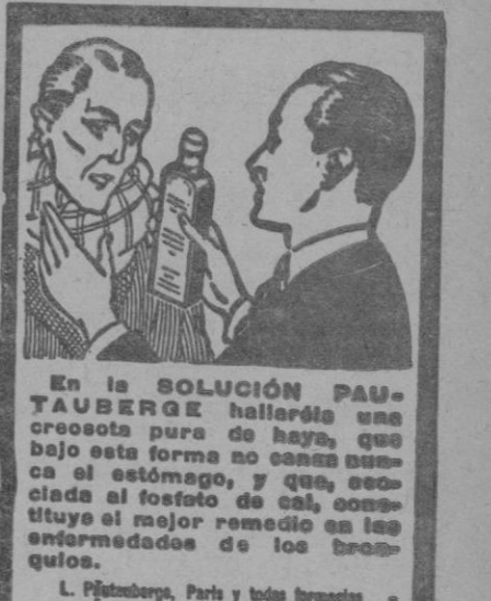
L. Pfisterberg, París y todas farmacias

primiremos el capitalismo, decretaremos el trabajo obligatorio y suprimiremos el dinero. Todos estos manejos de la estabilización y de la revalorización son ridículas supervivencias de la civilización burguesa...»