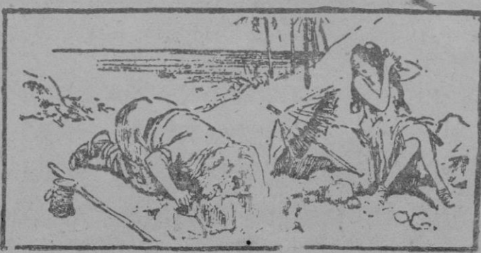
Ella (a su marido, que está bebiendo agua).—Ten cuidado, querido, no bebas mucha, que ese es mi único espejo.