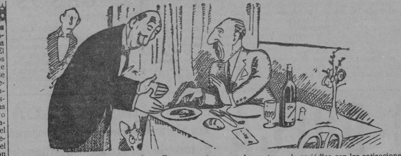
—Debería usted vigilar las cocinas. Esta carne tiene pegado un trozo de periódico con las cotizaciones de Bolsa... —¡Precisamente, señor! Es vaca a la financiera.

No se devuelven los originales ni se sostiene correspondencia respecto a la colaboración no solicitada.