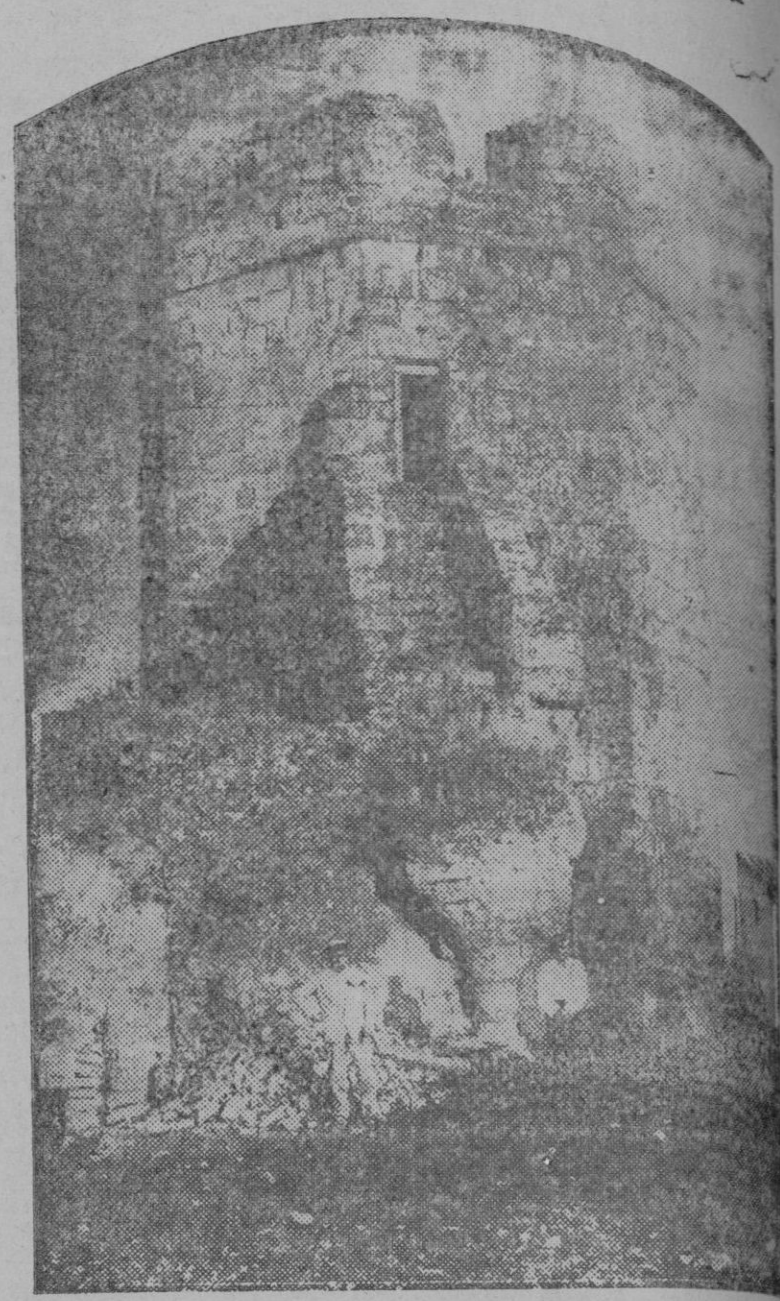
Magnífico torreón de la época romana que limita con el Alcázar viejo de Córdoba, y cuya escalera, de extraordinario mérito histórico, amenaza derrumbarse