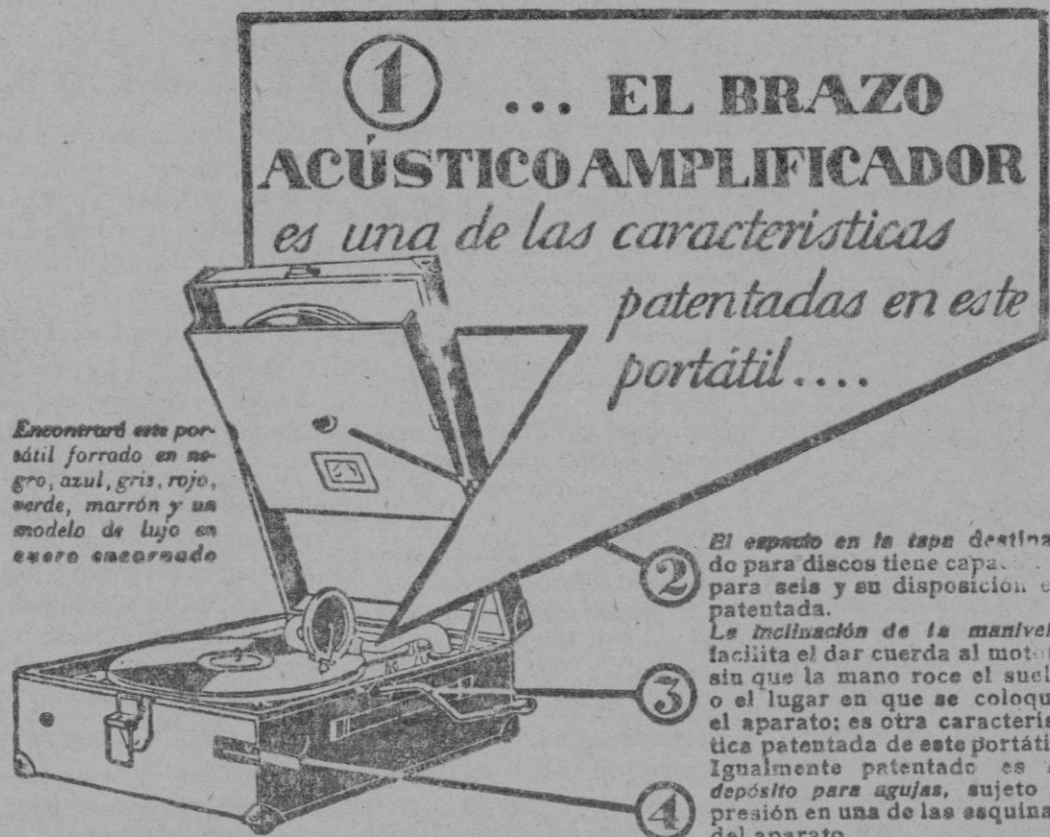
Encontrará este portátil forrado en negro, azul, gris, rojo, verde, marrón y un modelo de lujo en cuero encarnado