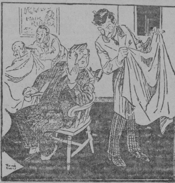
El peluquero.—¿Afeitó o cortó el pelo? El cliente.—Nada de eso. Póngame en seguida una toalla sobre la cara. Ese que está cortándose el pelo es mi jefe... y yo me he escapado de la oficina antes de la hora.

Advertimos a nuestros comunicantes que toda la correspondencia relativa al periódico, excepto la administrativa, debe ir dirigida a la Dirección de mismo