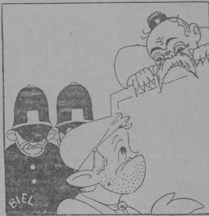
El comisario.—Diga Vd. ¿Porqué pegó tan barbaeramente a su mujer? El delincuente.—Nada Sr. Comisario. Todo lo sé como me echas un discurso y hoy, yo, le he definido mi actitud.