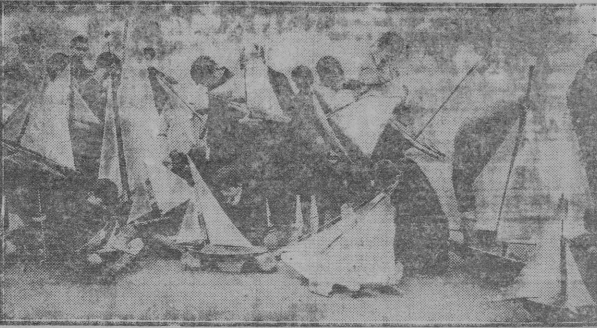
Los niños ingleses se preparan para las regatas, con sus pequeños balandros, en el lago Rensington (Londres)

Otras. —Empiezan en San Felipe Neri, que los Asociados a la Comunidad Reparadora y a la Cruzada de los Angeles dedican en honor del Sacratísimo Corazón de Jesús. A las siete, Misa de Comunión general con plática.