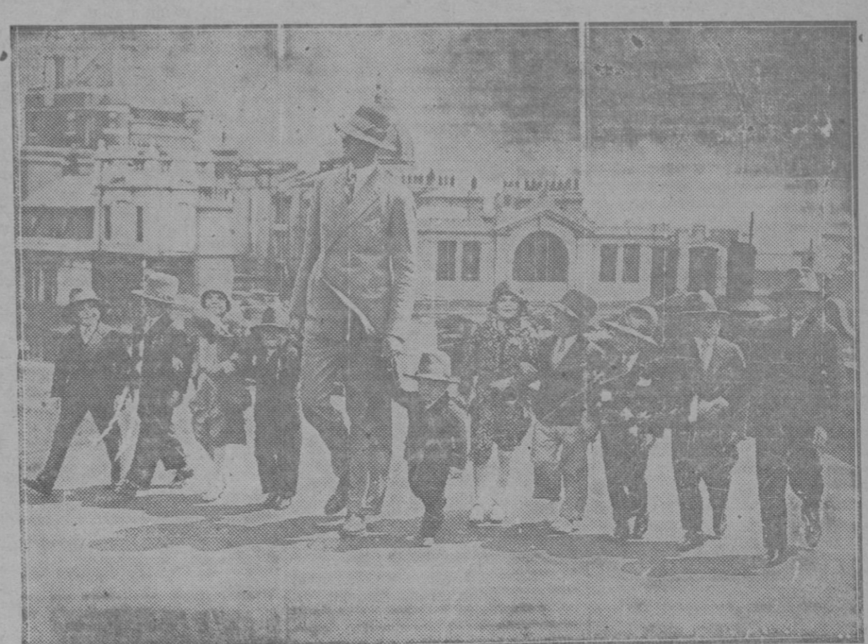
El hombre más alto del mundo paseando con una «troupe» de liliputienses por las calles de Londres

Cada una de estas películas costará alrededor de quinientos mil dólares y todo el mundo sabe que el cos-