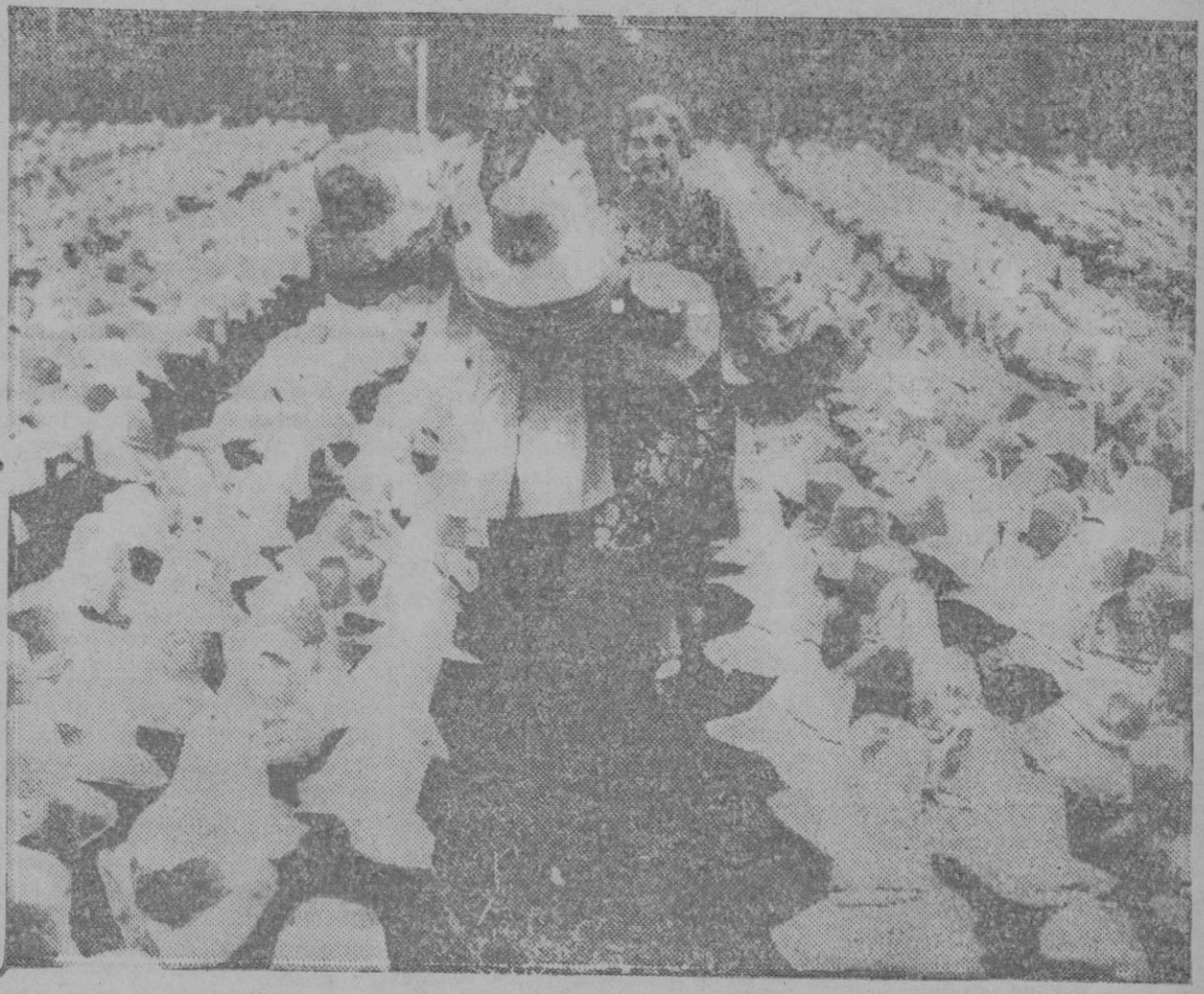
En la factoría inglesa de Luton se ponen los sombreros de paja a secar al sol en extensos campos. Parecen una colección de setas enormes. Estos sombreros serán lucidos en el verano que se avecina

A las 9 de la mañana.—Misa mayor cantada (en la Ermita), con asistencia de las autoridades, predicando las glorias del Santo, el orador sagrado don Miguel Fuster, Vicario de Inca.