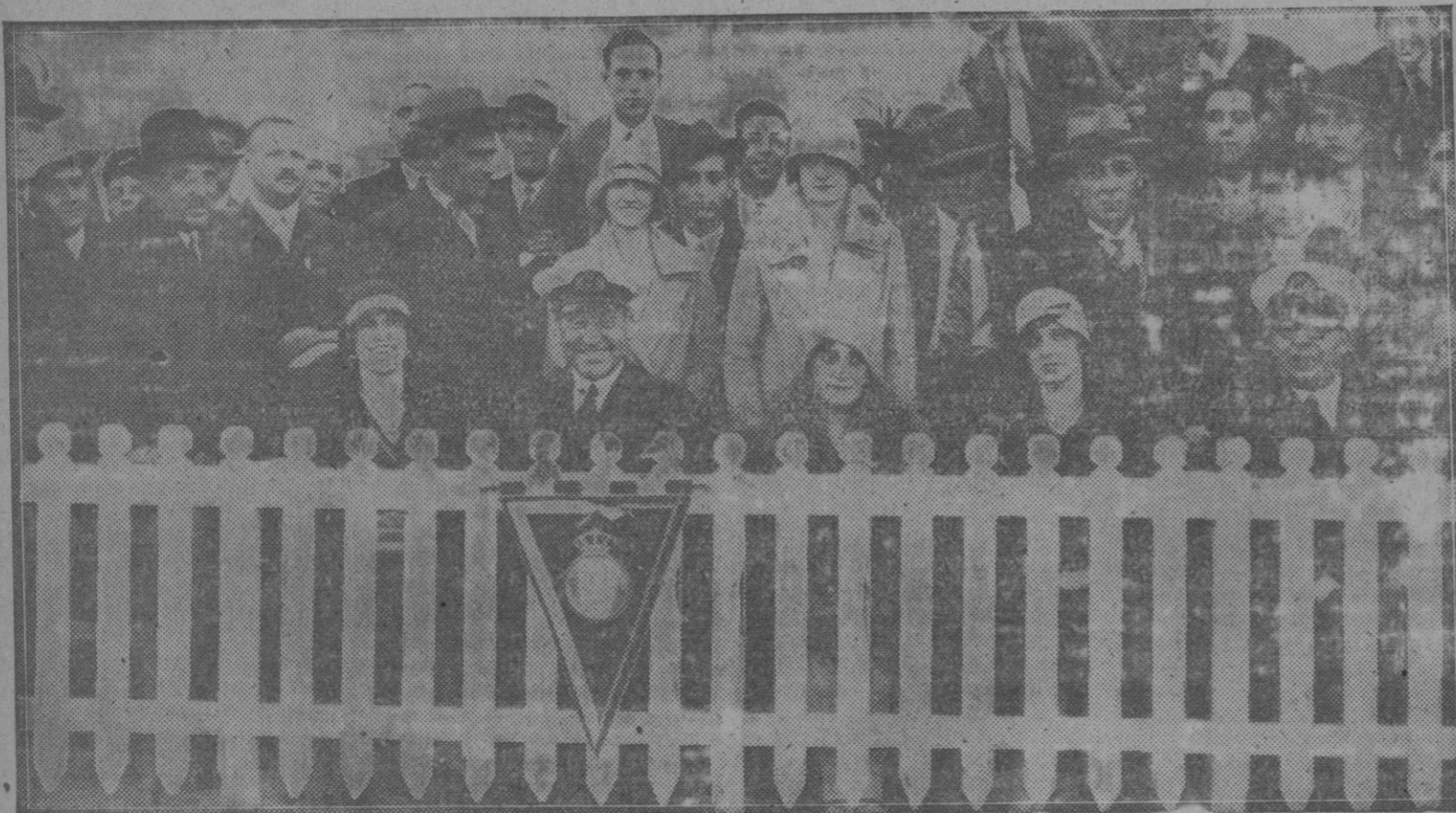
Sevilla: El comandante de la fragata «Sarmiento», con el banderín que el Real Belts regaló al «once» de dicha fragata

Alberto González Sastrería y Camisería Brossa, 12