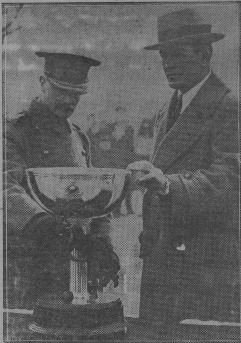
El boxeador Gene Tunney ofrece la copa que regala a los marineros norteamericanos al capitán del equipo de fútbol de los marineros ingleses, mister Halliday

Se la dió el director saliente. Se cambiaron los discursos acostumbrados.