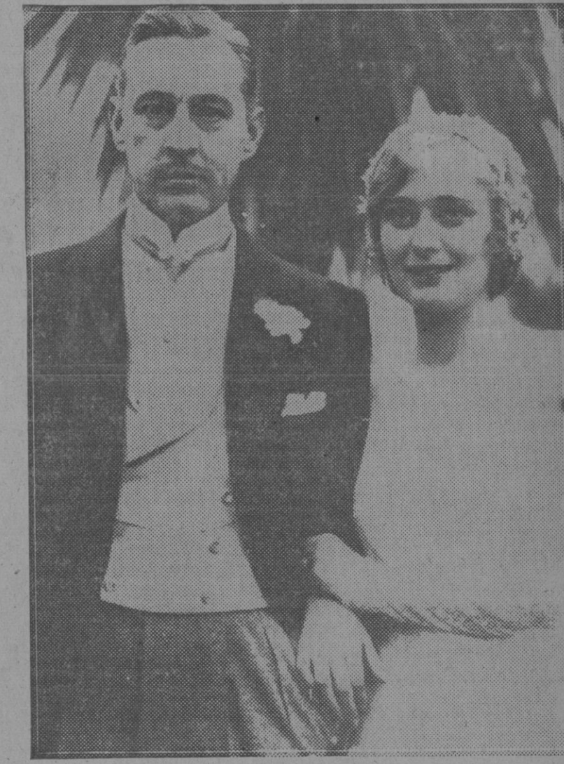
He aquí a Dolores Costello y a John Barrymore, el último matrimonio salido de Hollywood esa magnífica agencia de divorcios y de enlaces nupciales...— John Barrymore pertenece a este tipo de galanes maduros, con perfume de sabia experiencia, que tanto complace a las muchachitas candorosas de ahora. Y Dolores Costello es una de esas mujercitas. Incluso para llegar a la boda tuvo que vencer Barrymore la resistencia paterna. Igual que si estuviese en España.