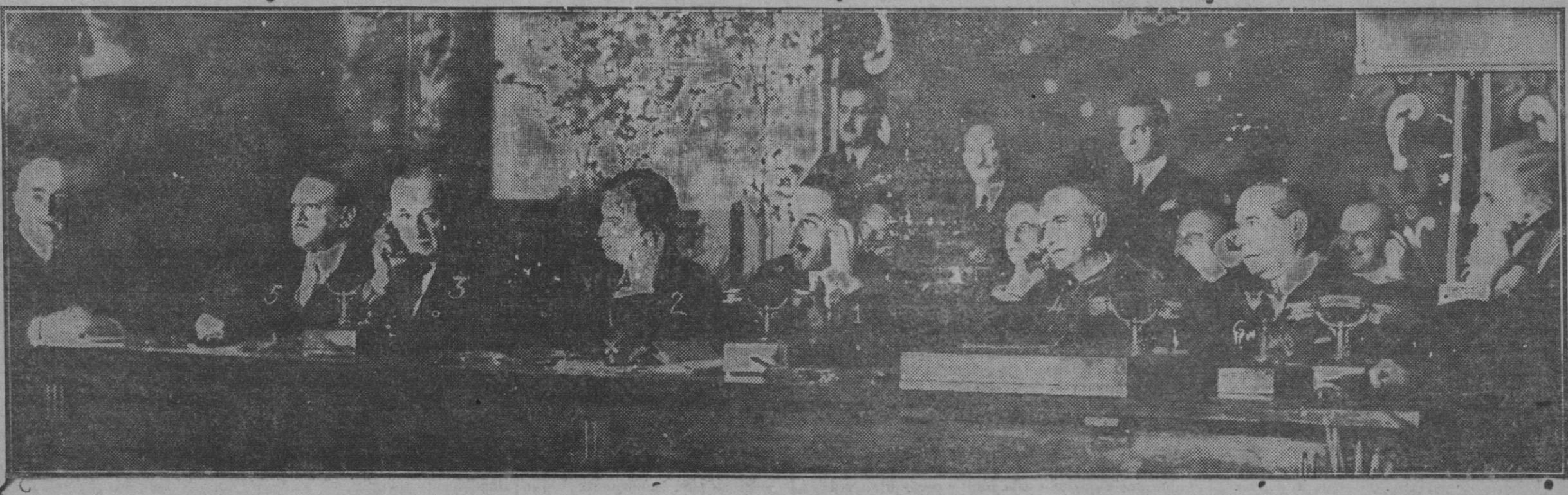
Su Majestad el Rey (1), el Infante Don Fernando (2), el general Primo de Rivera (3), el nuncio de Su Santidad (4), el ministro de la Gobernación (5) y el embajador de Cuba en España, Sr. García Kohly (6), en la inauguración del servicio establecido entre España y Cuba