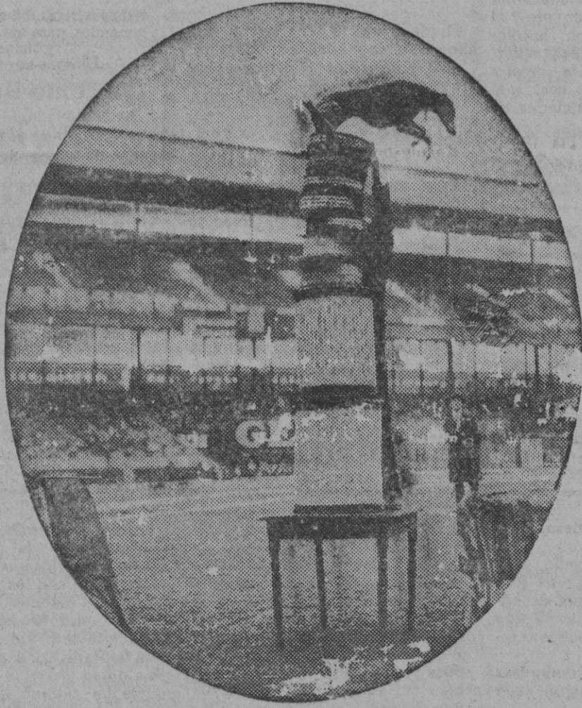
El perro «Rambling Gold», que ha establecido el «record» de salto con uno de doce pies y dos pulgadas. El hecho, naturalmente, ha ocurrido en los Estados Unidos