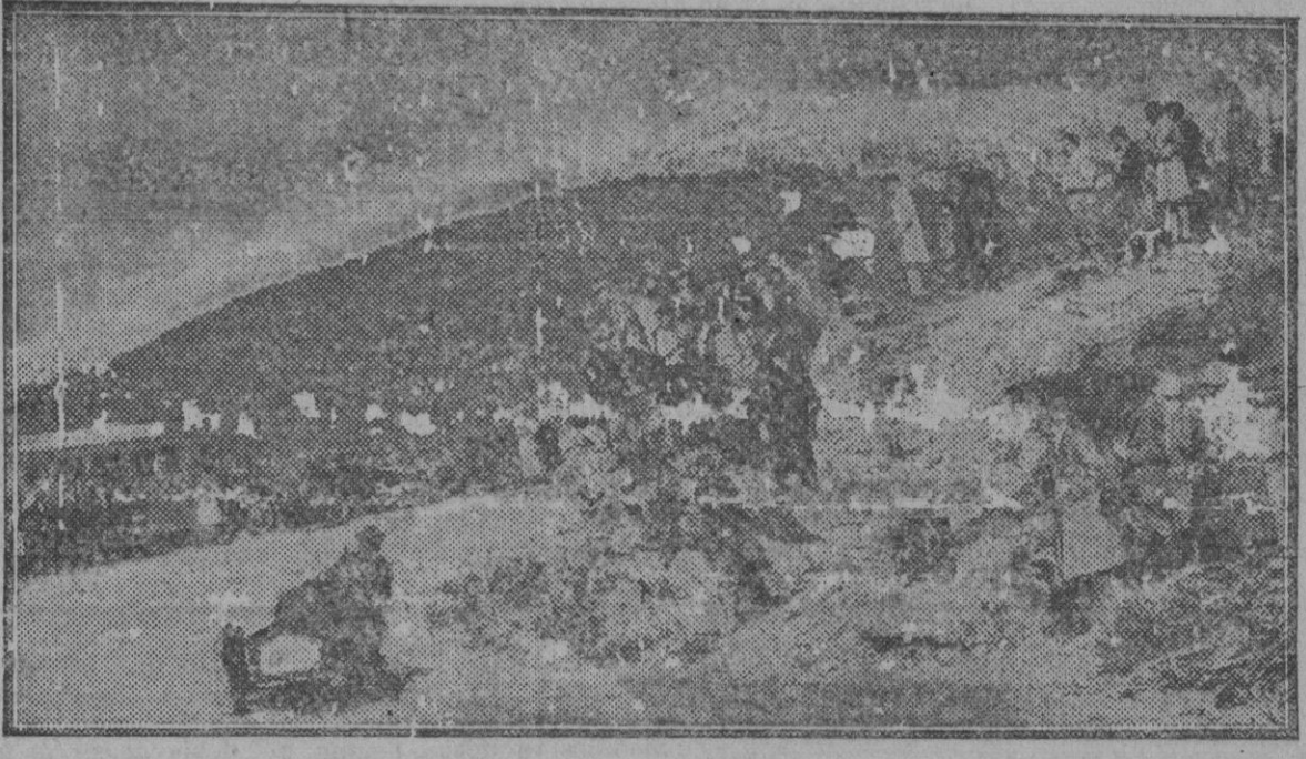
Un momento de la interesante prueba motorista titulada Subida al Puerto de Navacerrada, celebrada recientemente