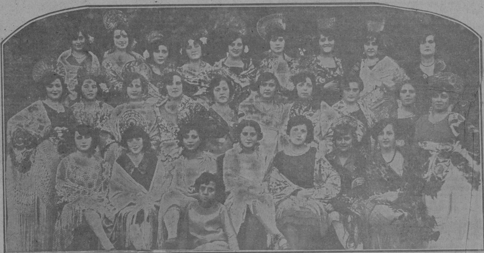
Valdepeñas: Bellas y distinguidas señoritas que tomaron parte en el festival benéfico celebrado en el teatro-cine Ideal por iniciativa de la Empresa del mismo

Por los damnificados por el incendio del Teatro de Novedades