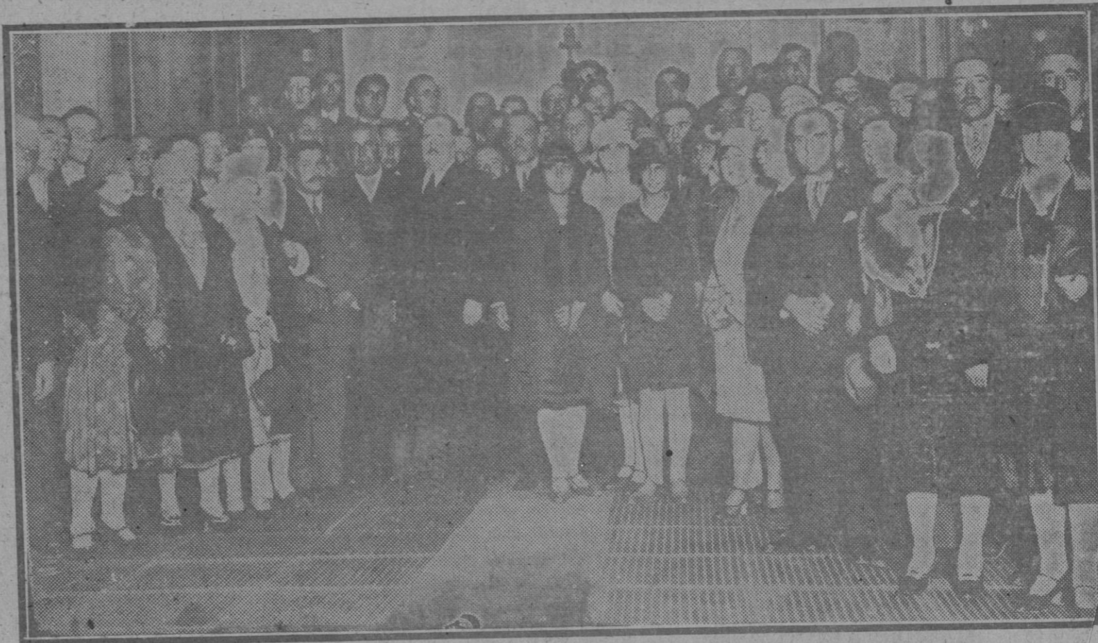
Los assembleistas farmacéuticos durante la recepción que en su honor se celebró en el Ayuntamiento de Madrid

Por los damnificados por el incendio del Teatro de Novedades