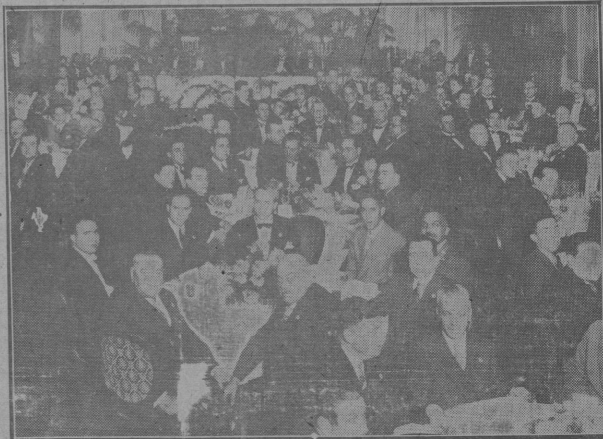
Barcelona.—Banquete celebrado en el Hotel Ritz para conmemorar la primera Exposición celebrada por la industria hotelera y de alimentación