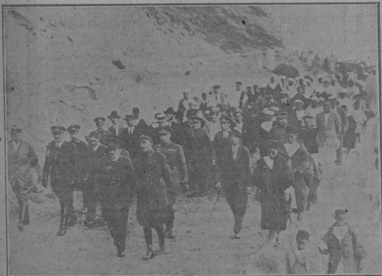
Cabo de Agua (Melilla): El alto comisario y sus acompañantes visitando las nuevas obras del puerto con motivo de la tralda de aguas