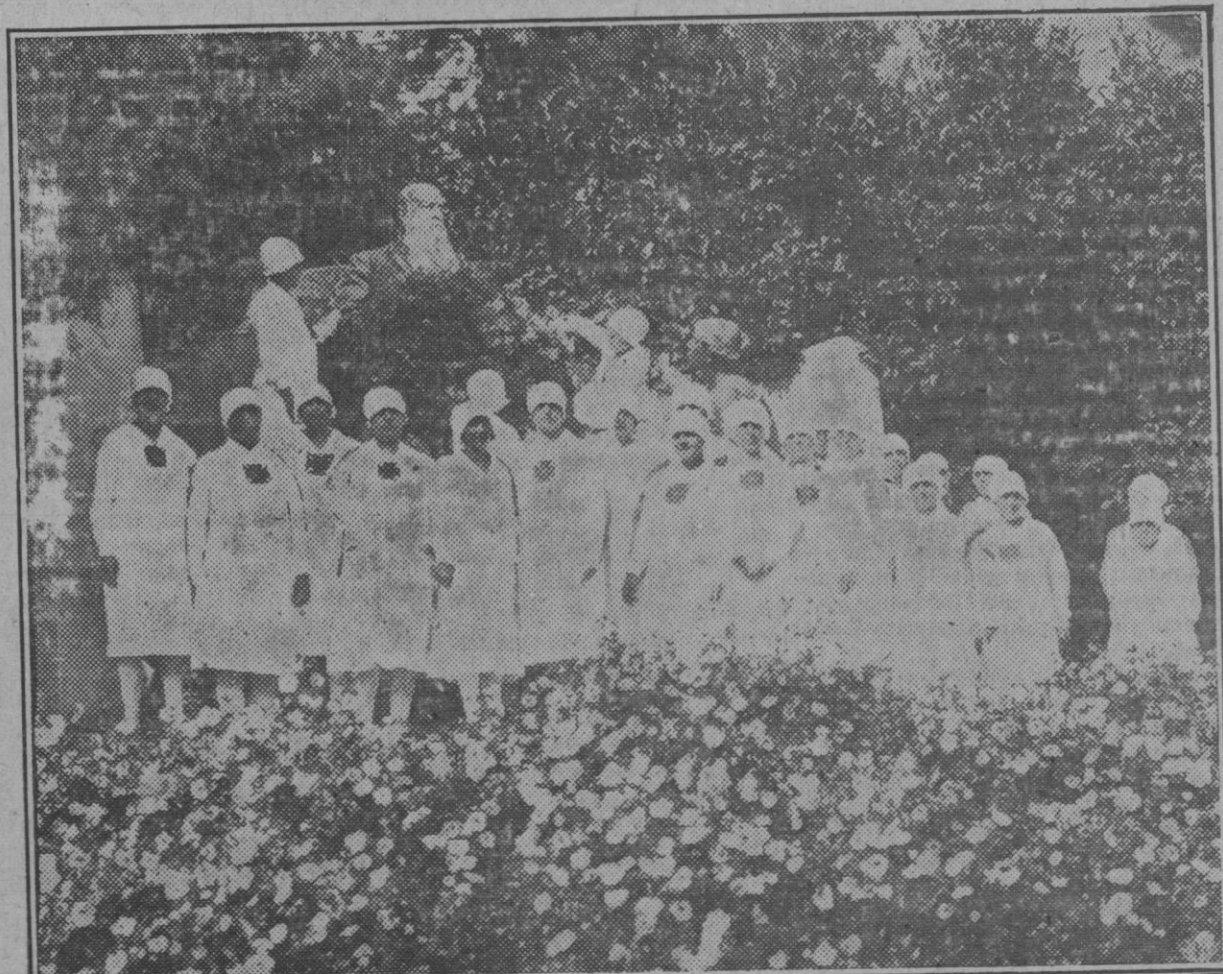
Las enfermeras colocando una corona de flores en la estatua del insigne fundador al terminar la ceremonia de apertura de curso en dicho Instituto