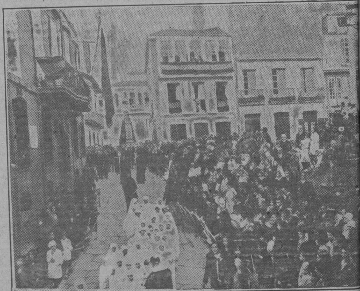
Coruña: La tradicional procesión que anualmente se celebra con motivo de la festividad de la Virgen del Rosario, Patrona de la capital gallega