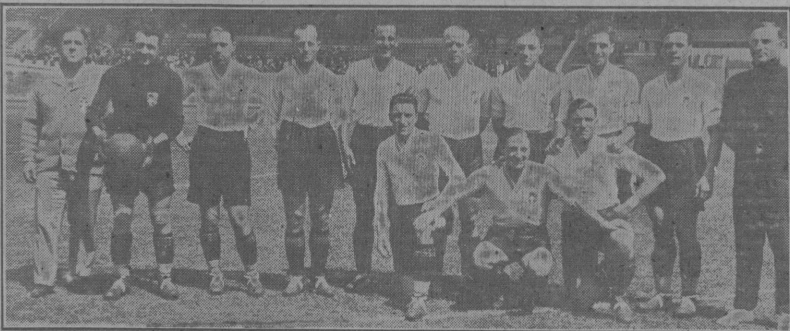
El once italiano, que empató a eno con España y que ayer la «aplastó» por 7 a 1 en el Estadio de Amsterdam