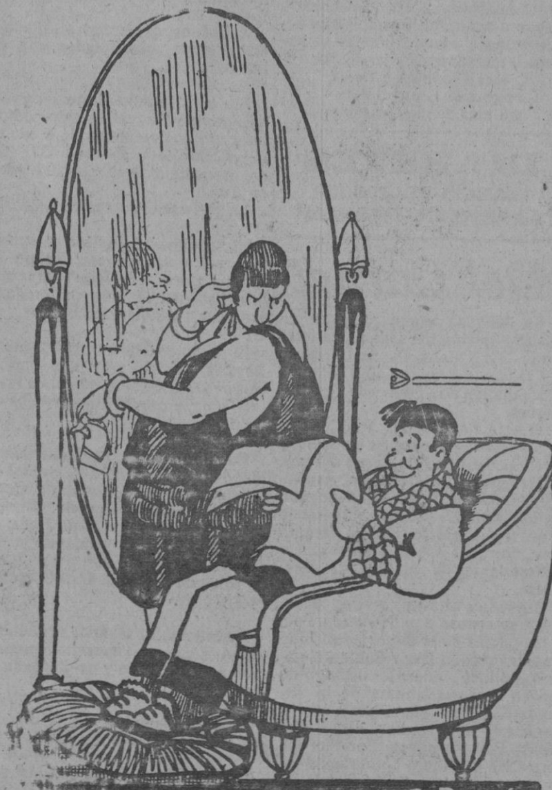
—¡Comodón! Si quiera por acompañarme, deberías venir. Buenas están las noches, para que una mujer vaya sola.

El Club americano de periodistas rehusa recibir a Mussolini, pues 25 de sus miembros están indignados por el modo con que se trata a la prensa en Italia.