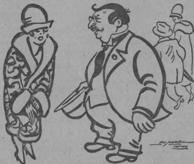
—¡Que cabello tan negro le ha quedado! —¡Gasta Vd. alquitrán!