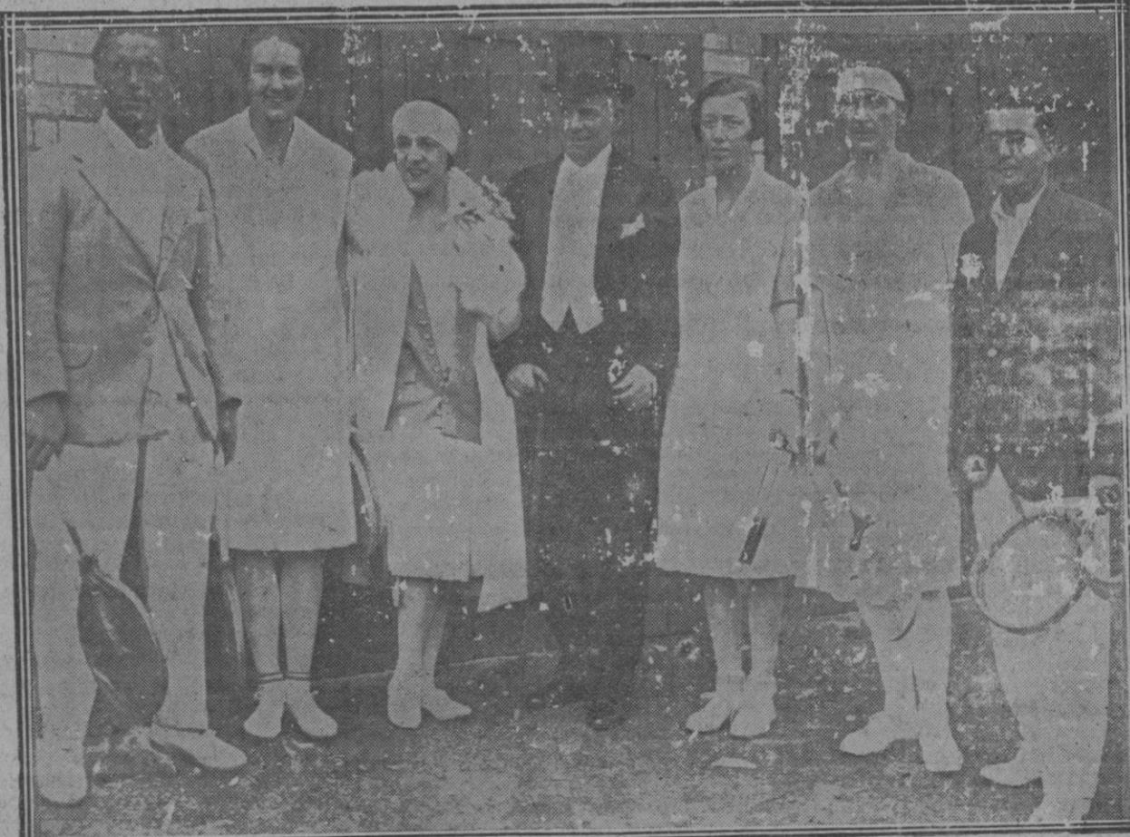
La campeón del mundo de «tennis», la «petite Susanne», rodeada de otros «tennistas», el día de su presentación como profesional en Inglaterra