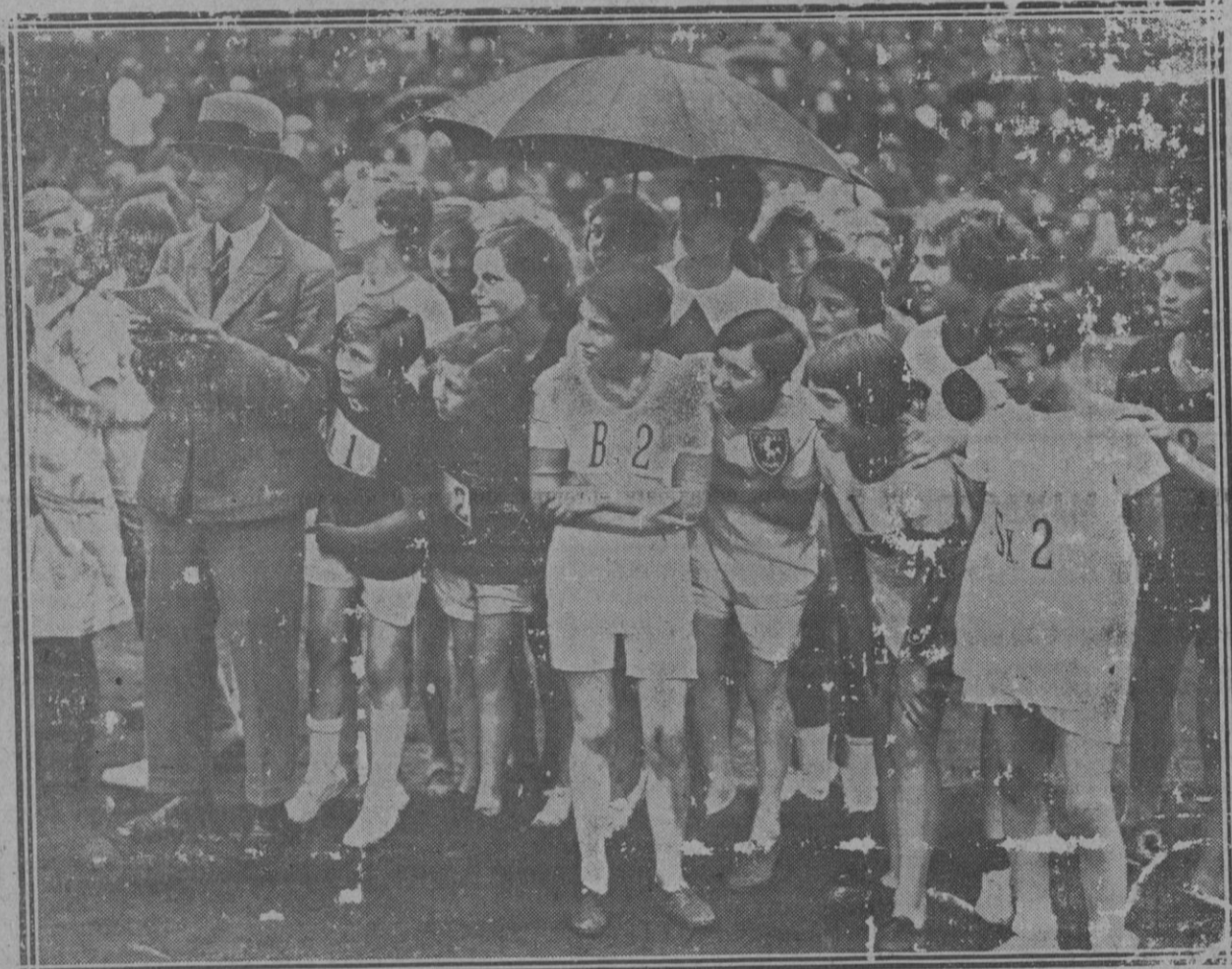
En Stamford Bridge se ha celebrado un concurso atlético femenino, en el que han intervenido gentiles muchachas entusiastas del deporte. He aquí algunas de ellas, presenciando y comentando los ejercicios que realizan sus compañeras.