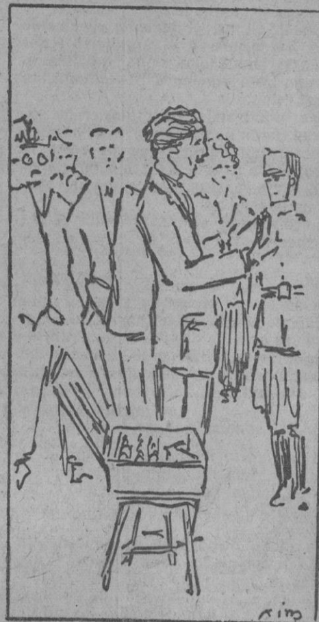
EL CHARLATÁN CALLEJERO

Parécenos que el charlatán callejero es un tipo bastante moderno. Antes, hace cincuenta años, no era conocido aquí. Era una importación extraña. Pero, de todas suertes es un tipo digno de atención y estudio. He aquí un hombre que deambula por nuestras calles y plazas, empujado por el viento del azar. No tiene un punto fijo, sino que sienta sus reales allí donde mejor le parece. Lo más probable es encontrarle en la plaza del Mercado, por la mañana, y también al desembocar la calle de Arabi en el paseo de la Rambla. ¿Qué predica el «charlatán»? Ni él mismo lo sabe. Pero pone en la peroración todo el calor del entusiasmo y en el acento toda la energía de quien está convencido de que «dice la verdad». Un día le oímos ponderar las excelencias de un «The payés», capaz de curar todos los males del estómago, y otro día vender relojes de pulsera de oro por cinco pesetas. A él lo que le interesa es que el público se convenza; un público convencido es capaz de creer en curas maravillosas y en relojes de oro de cinco pesetas. ¿No será esto, acaso, el principal objetivo del charlatán: convencer? ¡Por eso abundan los charlatanes en todos los órdenes de la vida: charlatanes en literatura, en arte, en filosofía, en ética, y hasta en la ciencia económica! El charlatanismo es, verdaderamente, una profesión.