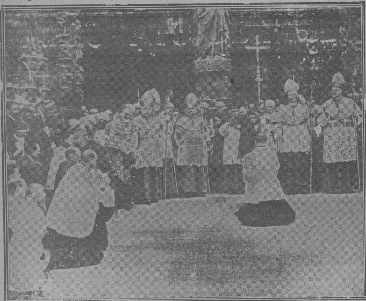
LA CONSAGRACION DE LA CATEDRAL DE REIMS Monseñor Luçon, cardenal-arzobispo de Reims, bendiciendo al pueblo desde las escaleras de la Catedral