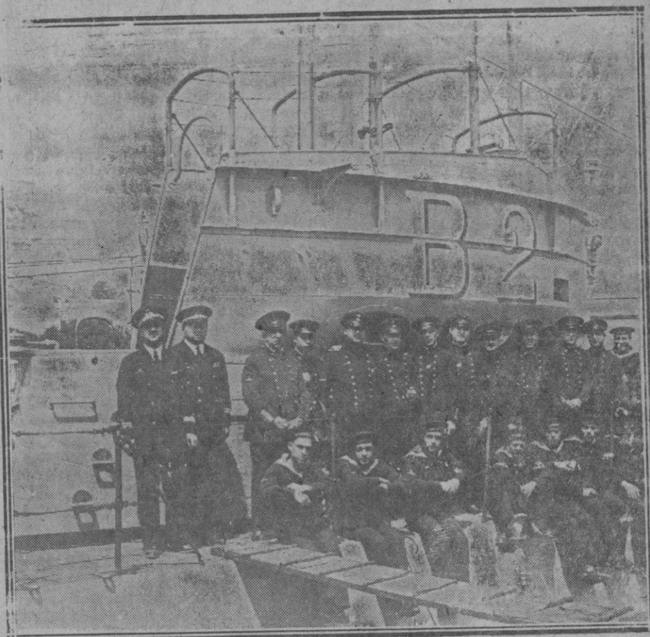
Cartagena.—La tripulación del submarino «B-2», que ha realizado recientemente importantes ejercicios de inmersión y velocidad.