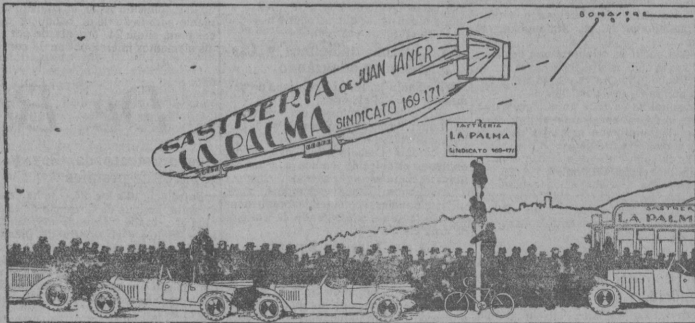
De sobra conoce Vd. lo barato que vende esta casa

LA LECHE CONDENSADA MARCA EL NIÑO con toda su crema, está elaborada con arreglo a los más modernos procedimientos científicos, como corresponde a una fábrica recientemente instalada; que es la última que se ha montado en España y por ello ofrece la máxima garantía. Reemplaza ventajosamente a la leche fresca en todos los casos en que esta se emplea. LA LECHE CONDENSADA MARCA EL NIÑO por su gran potencia nutritiva, no tiene rival para la más perfecta alimentación de los niños. Es, por excelencia, la leche del hogar, y por tanto, no debe faltar en el suyo. Pruebe hoy mismo la LECHE CONDENSADA MARCA EL NIÑO y quedará plenamente convencido de su alta e insuperable calidad. LECHE CONDENSADA MARCA EL NIÑO ES LA MEJOR Solicite muestras y folletos gratis de la Sociedad Lechera Montañesa A. E., Plaza de Cataluña, 17. BARCELONA. Guarden las etiquetas para participar en el interesante Concurso que empezó el 15 de Mayo actual para terminar el 15 de Septiembre del corriente año y en el cual se distribuirán 32.000 pesetas en regalos a los consumidores de la LECHE CONDENSADA MARCA EL NIÑO. SOCIEDAD LECHERA MONTAÑESA A. E. 5.000.000 de pesetas de capital TOTALMENTE NACIONAL