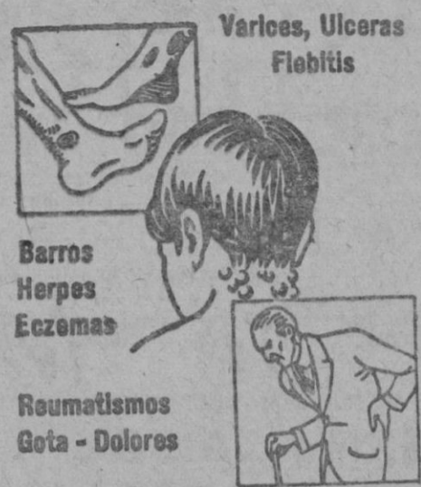
Varices, Ulceras Fiebrilis