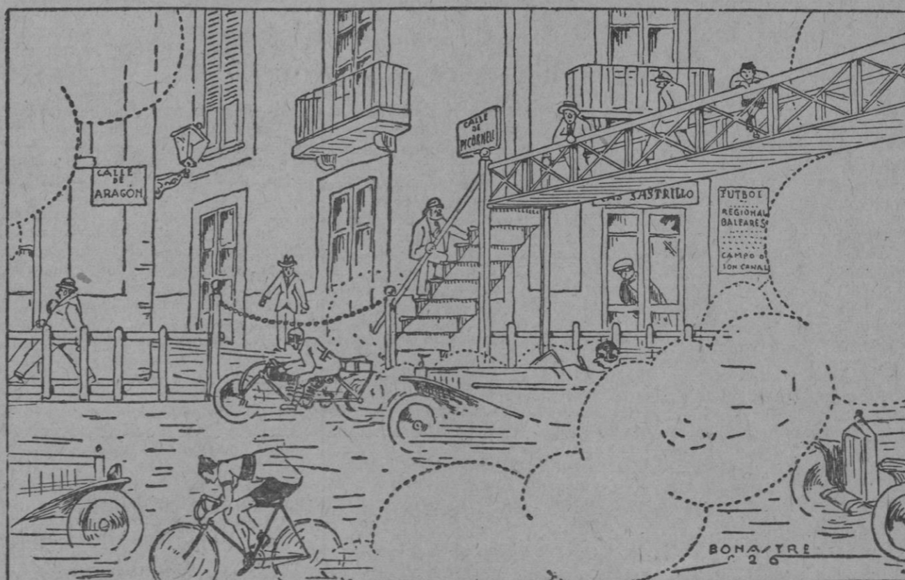
La seguridad en nuestros autódromos.