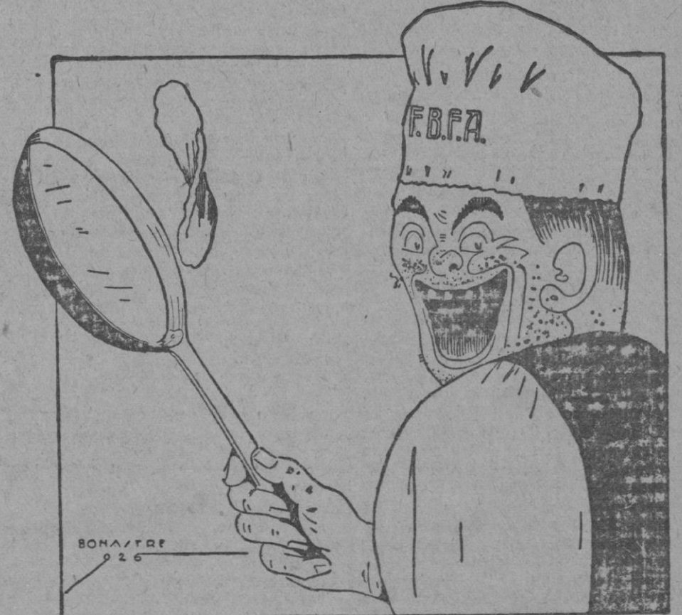
La solución inminente