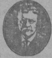
Theodore Roosevelt dijo:

Nos parece que en cuarenta y dos años de vida parlamentaria ininterrumpida ya