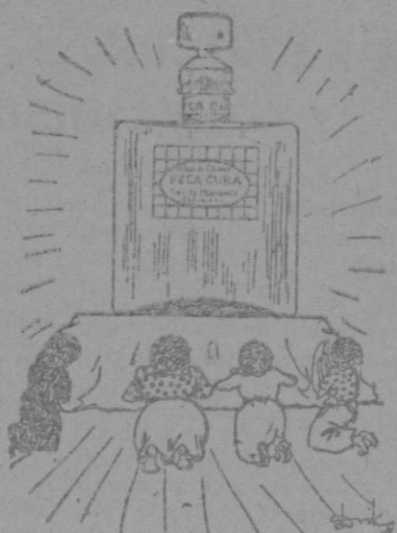
Después de Dios... la Peca Cura

FINCA Se vende una nueva en el ensanche com- puesta de bajos, 3 pisos, almacén y estenso solar, produce buen interés. Razon: calle Obispo, 6.