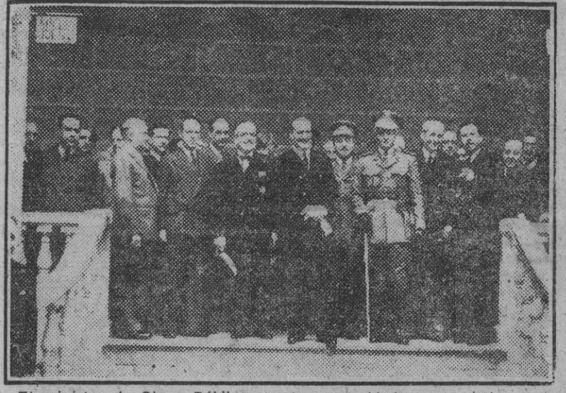
El ministro de Obras Públicas y otras autoridades que asistieron al acto religioso celebrado esta mañana en la iglesia de San Gines con motivo de la festividad de Santo Domingo de la Calzada, Patron del Cuerpo de Obras Públicas.