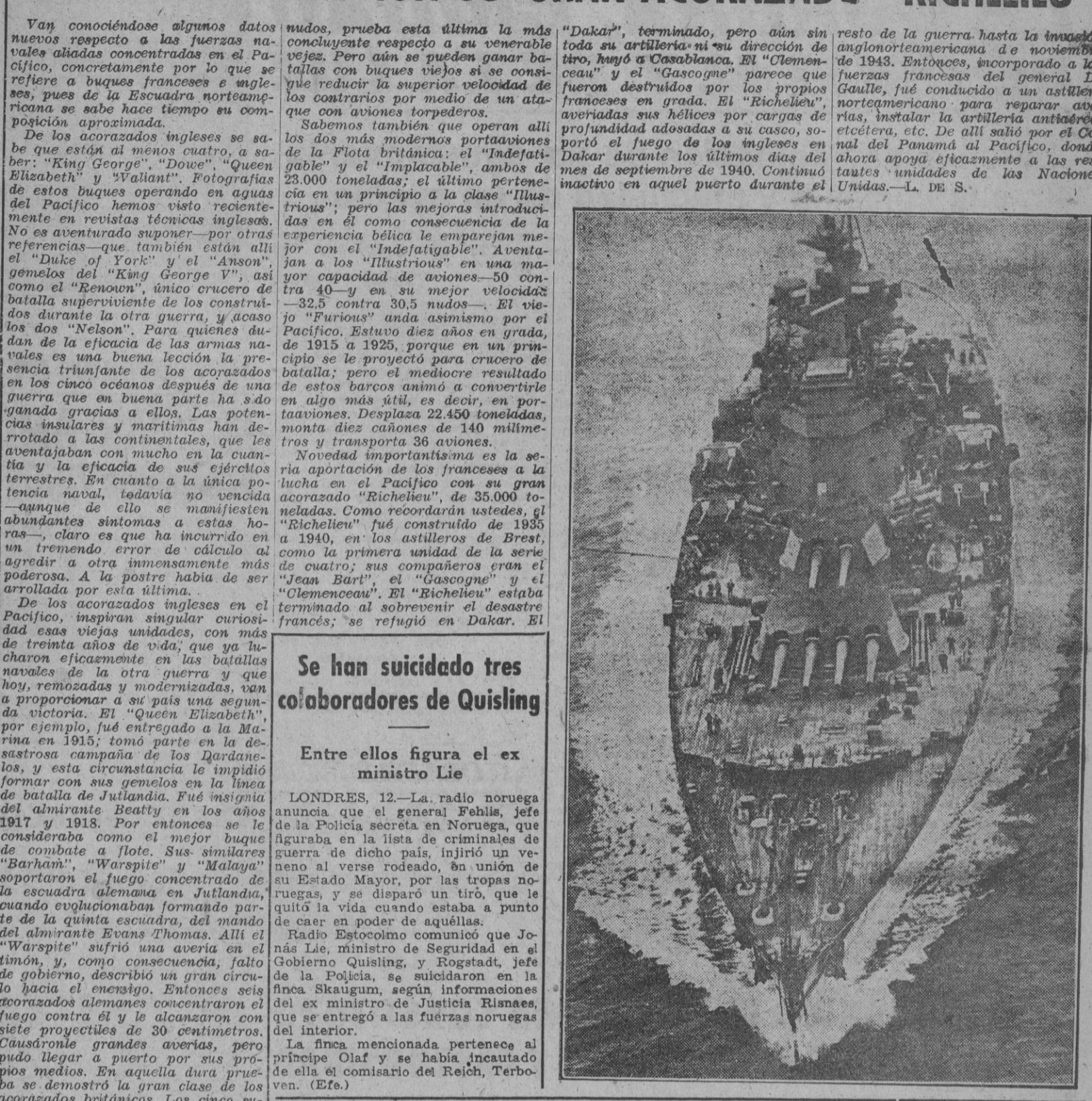
El acorazado francés "Richelieu" en el puerto de Dakar.

El semanario izquierdista "New Statesman" lamenta la imposición de Gobiernos de un solo partido en todos los Estados que limitan con Rusia. (Efe.)