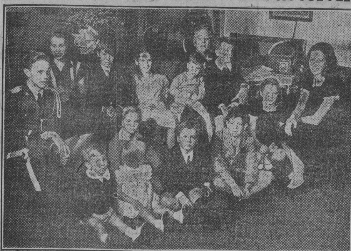
El ex-fulú Presidente de los Estados Unidos posa en unión de sus nietos el día de inauguración de su cuarto mandato presidencial.