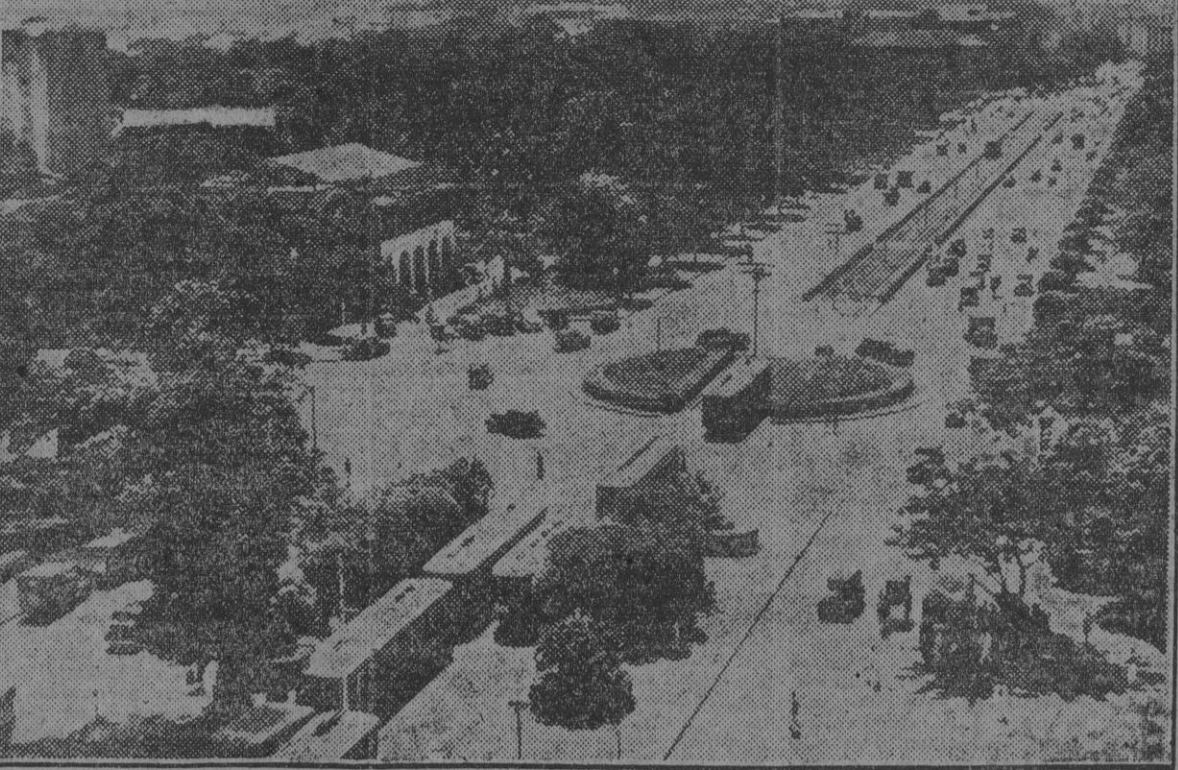
El bulevar de Rizal, uno de los más largos y famosos de Manila.